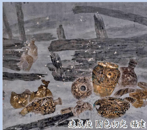
趙成俊 國色初光 福建