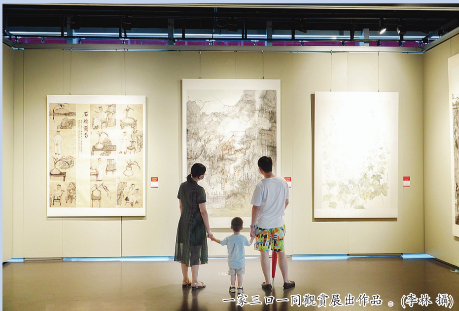
一家三口同觀展出作品。

8月6日，“大美漳州——全國中國畫作品展”在漳州市美術館(新館)開展。作品展由中國美術家協會、福建省文學藝術界聯合會、漳州市人民政府共同主辦。